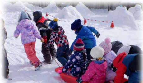
【昨年度の「雪遊び交流」から】

〔2月27日（火）〕…「雪遊び交流」：1学年児童&年中児との交流活動 ●年中：きりん組・ぞう組